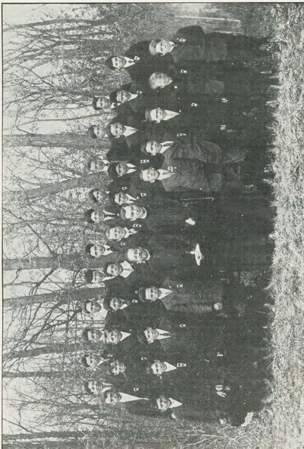
CONGREGATION DES SAINTS ANGES