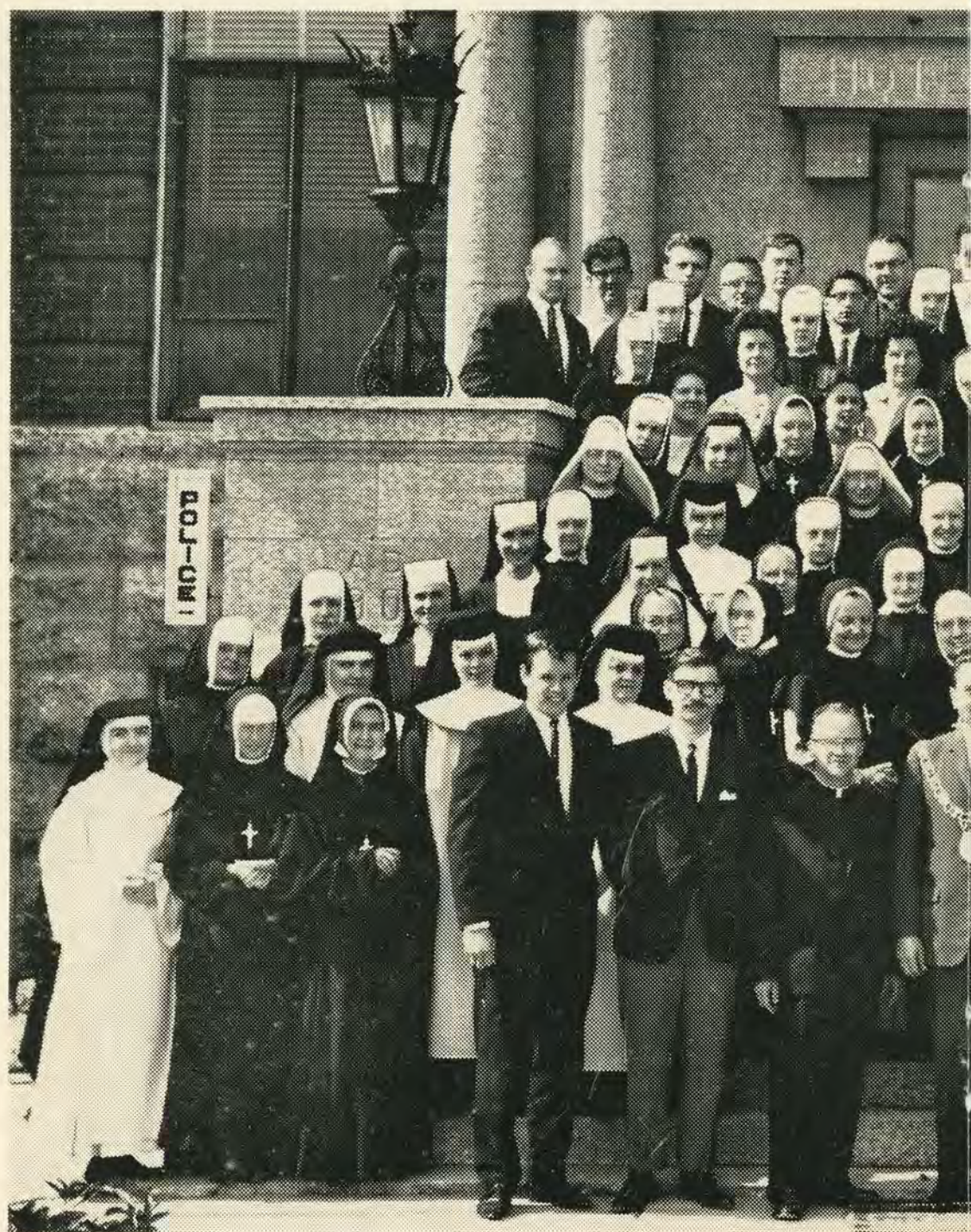
Groupe d'étudiants et professeurs des Cours d'Été 1963 reçus à l'Hôtel