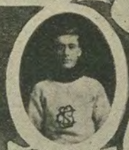
E. La Fleche