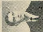
R. PICHE COMS.