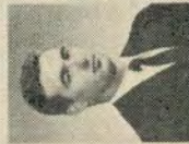
E. HOGUE V. PRES.