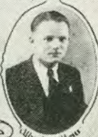
Alfred de Steno