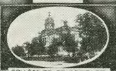
COLLÈGE DE ST-BONIFACE