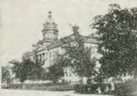
Collège de St-Basile